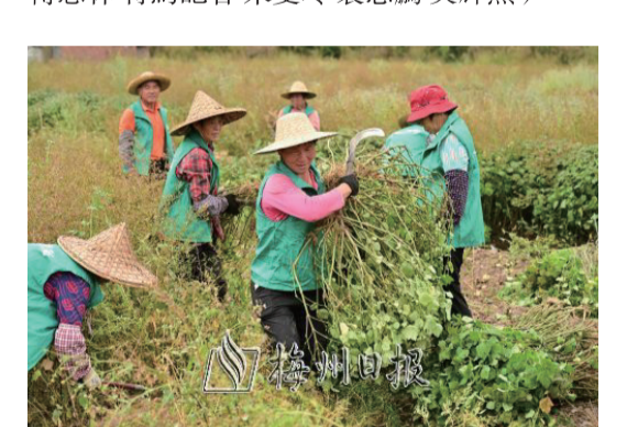
農戶揮起鐮刀,將廣藿香連株割下後,整齊攬到一旁進行稱重。

以平遠縣熱柘鎮為例,通過“縣鎮統籌、跨村聯建”模式,建立“企業+村集體+農業社會化服務+農戶”的合作經營模式和“保底收益+產值分紅+勞務優先”的利益聯結機制,預計到今年年底,熱柘鎮8個行政村集體經濟年收入均能突破15萬元。(本報記者傅思林特約記者朱雙玲 袁志鵬 吳輝燕)