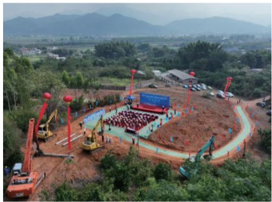
本報訊(記者丘瓊)近日,蕉嶺縣新鋪鎮綠色低碳“光伏小鎮”鄉村振興示範項目一期在新鋪鎮獅山村開工(如上圖

)。據悉,該項目計劃總投資約9億元,總體規劃220兆瓦(地面集中式光伏規模200兆瓦、屋頂分布式光伏規模20兆瓦),其中一期規模64.22兆瓦、計劃投資約2.9億元。 據了解,綠色低碳“光伏小鎮”鄉村振興示範項目是新鋪鎮駐鎮幫鎮扶村工作隊牽頭單位廣州發展集團屬下新能源公司投資建設的第一個全域開發項目。該項目以光伏發電為核心,以光伏農業、光伏服務、光伏旅遊為延伸,圍繞“光伏概念”主題,融合科技創新技術,探索“光伏+農業+旅遊”新發